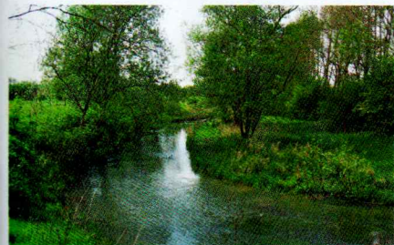
La Ternoise, près d'Anvin.