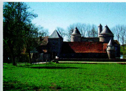
Le château d'Olhain à Fresnicourt.