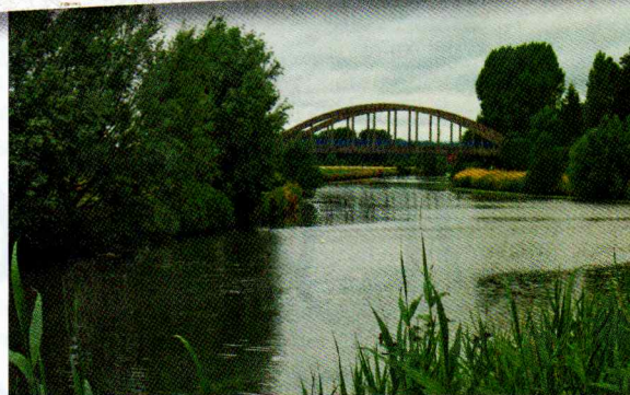
La Lys à Frelinghien.