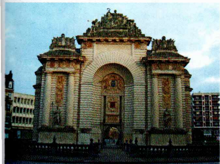
La Porte de Paris à Lille.

villages, des estaminets, dont quelques uns ont conservé leurs jeux traditionnels, ouvrent leurs portes aux randonneurs. La présentation ne serait pas complète sans préciser que les villes de Lille et de Loos possèdent chacune un beffroi classé au patrimoine mondial de l'Unesco et que le village d'Annequin possède une cité minière, elle aussi, classée à ce patrimoine. Enfin, l'itinéraire traverse une partie du Parc naturel régional des caps et marais d'Opale et des lieux du souvenir dans les Weppes et les collines d'Artois, au cœur de champs de bataille de la Première Guerre mondiale. ■